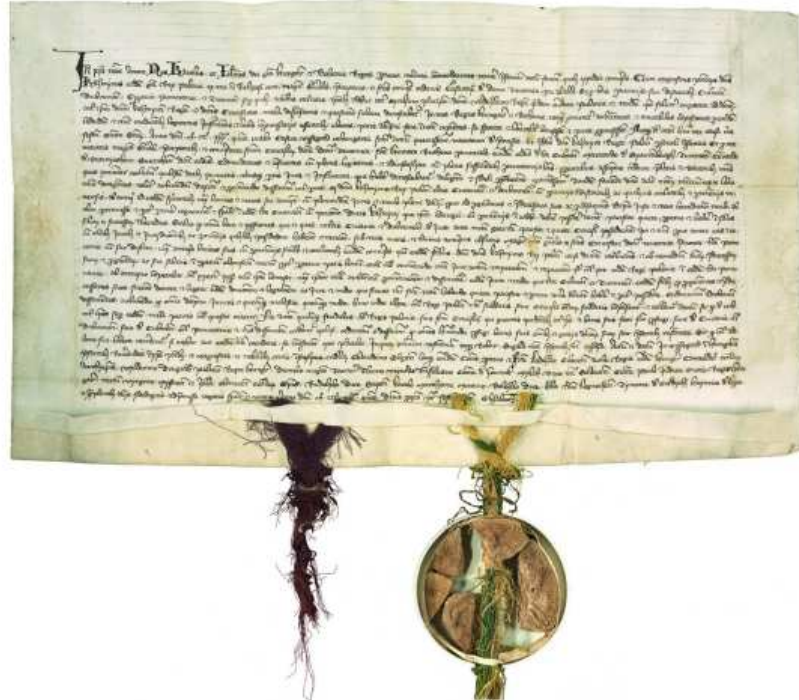
Original: Archives centrales secrètes de Prusse, Berlin