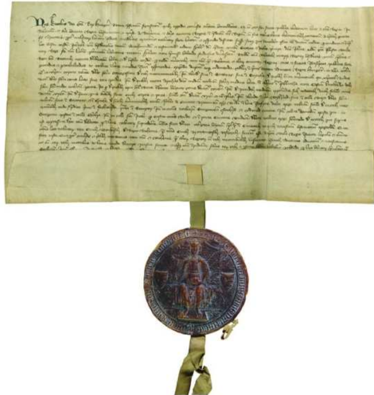
Original: Archives de la ville de Brno, Brno