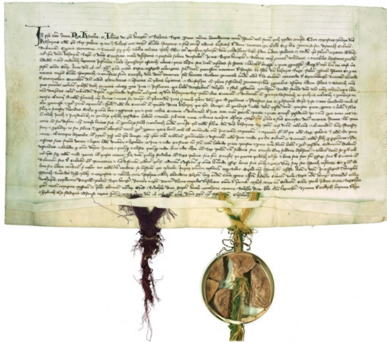
Original: Arquivo Central Secreto da Prússia, Berlim

Em 26 de Novembro de 1335, o rei Carlos da Hungria e o rei João da Boémia concordam nas soluções sobre o conflito entre o rei da Polónia e a Ordem dos Cavaleiros Teutônicos no Congresso Real em Visegrad.