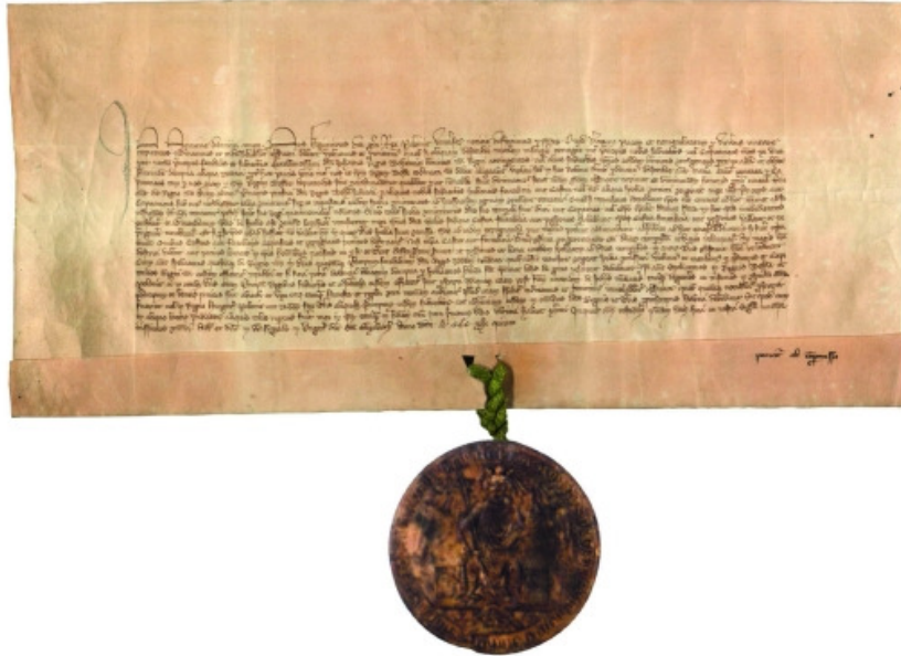
Original: Arquivos Nacionais, Praga